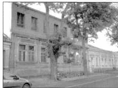
2. kép: A városi rendelő