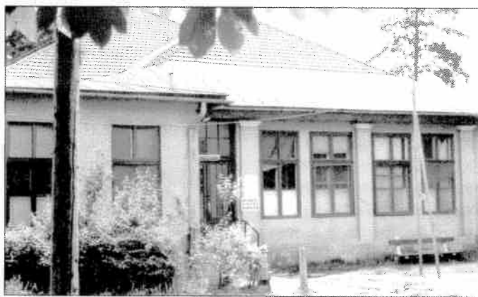
3. A szemészeti osztály bejárata

Az új önállóvá vált osztályt, a kórház „C” ún. tüdő-