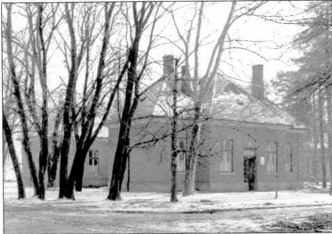
1. kép: Az Erzsébet Közkórház fertőző osztálya

Évszázadokon át az emberiség legnagyobb veszedelmét a fertőző betegségek jelentették. Országok városok néptelenedtek el miattuk. A történelem folyamán több ember halt meg járványos betegségek következtében,