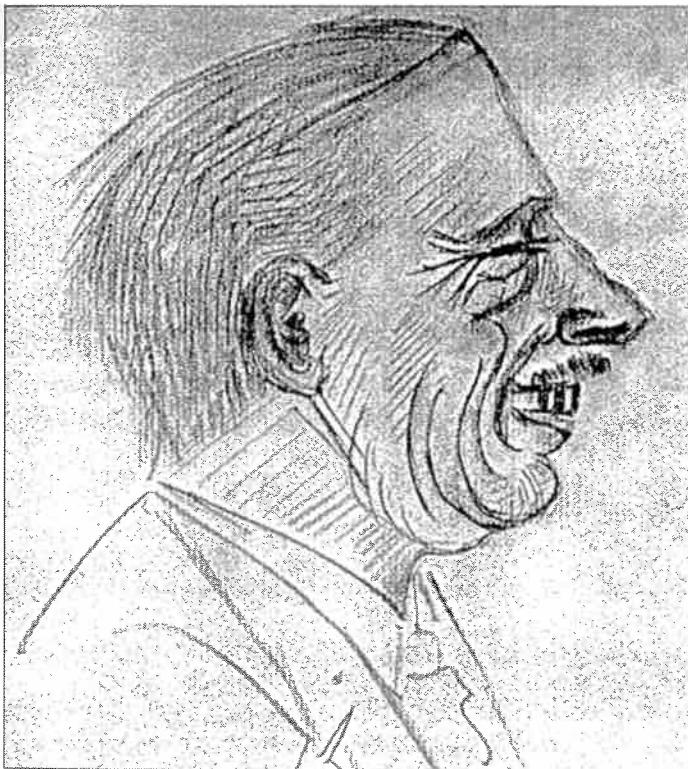
Karikaturistának is kiváló volt...