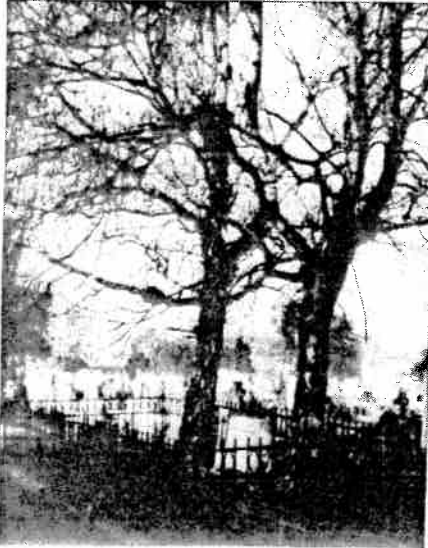
29. kép. A Nyírség kutatójának kívánsága szerint: két nyírfa őrzi sírját (Északi temető, XV. parcella)